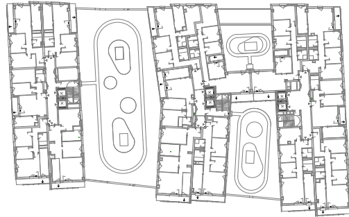
GARAJEA-TRASTELEKUA. 2-SOTUA GARAJE-TRASTERO. PLANTA SÓTANO -2